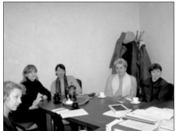
Integrācijas darba grupa pieredzes apmaiņā Ādažos.

Šo projektu paredzēts īstenot sadarbībā ar pieaicinātajiem speciālistiem no Rīgas rajona padomes un Sabiedrības integrācijas fonda, taču vis-