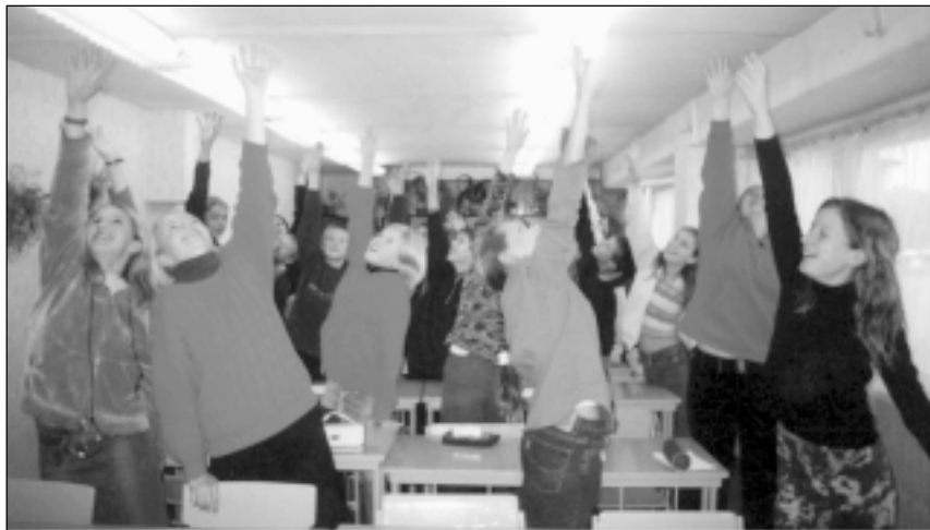
"Iesildīšanās" Runas kultūras pulciņa nodarbība.