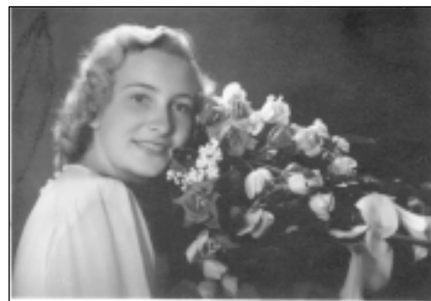
Iesvētības. 1947. gads.

Kad ziemā atgriezāmies, mums Rīgā iedeva 10 rubļus. Pārtikām tikai no labu