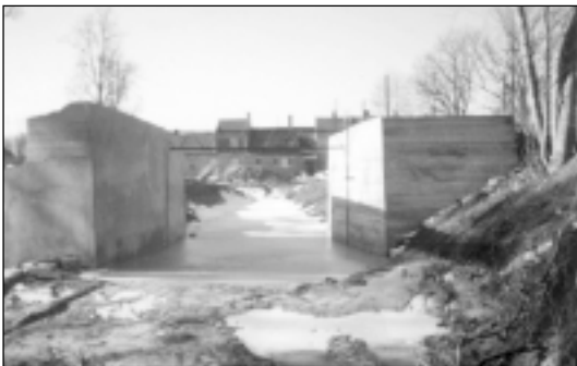
Ieplūdes kanāla sākums.