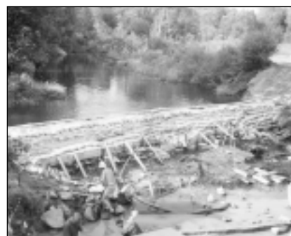
Dambja būvniecība 2002. gadā.