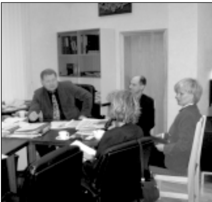
Tikšanās ar Ādažu pagasta padomes priekšsēdētāju.