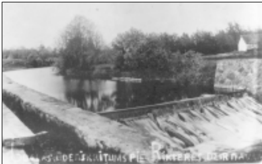
Rikteres dzirnavu dambs 30. gadā.

Iestājoties pavasarim, visu triju HES īpašnieki ir garantējuši turpināt teritoriju sakārtošanu un veikt to labiekārtošanu.