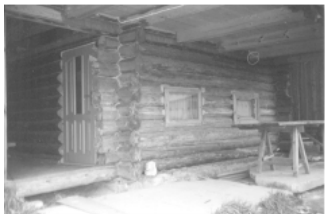
Guļbaļķu pirtīņa patiešām izskatās ļoti jauka.