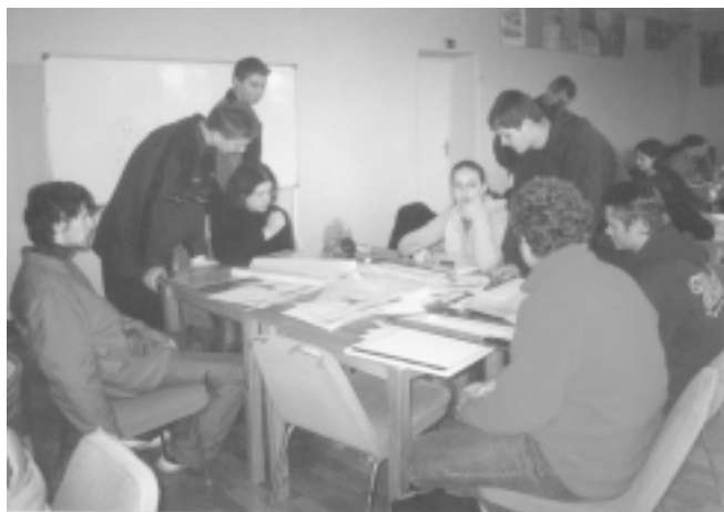
Projektēšanas darba moments.