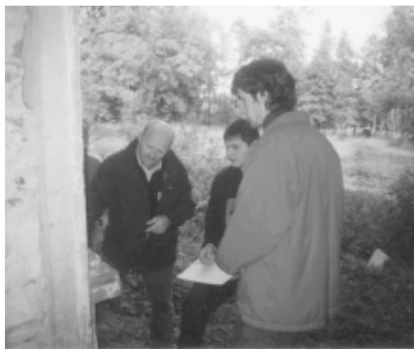
Vācu skolotājs konsultē mālpiliešus uzmērīšanas darbos.