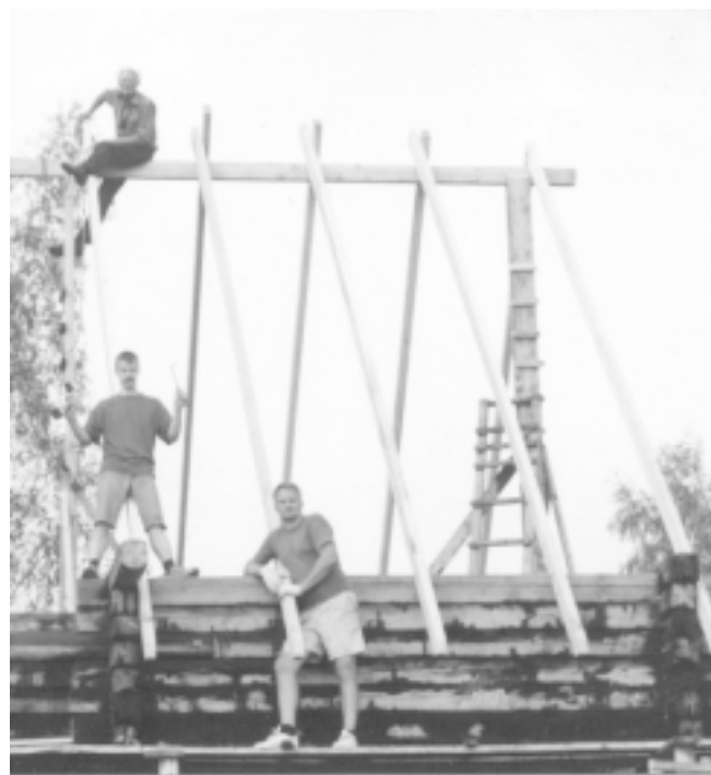
2002. gada vasara. "Mežmalām" top spāres.