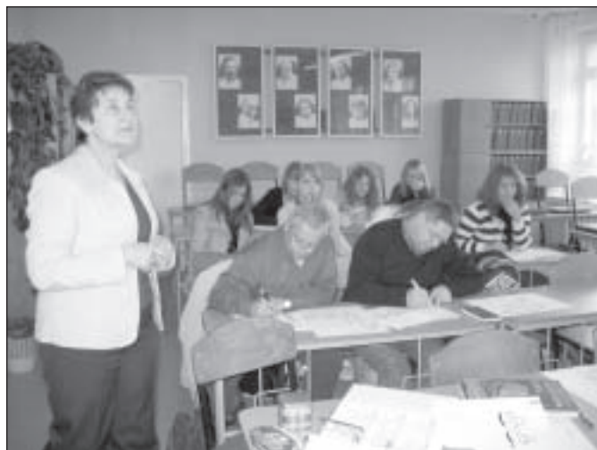
Latviešu valodas nodarbības

Projekta noslēgums bija 22. martā, kad mīļajā "Vecmāmiņas virtuvē" draudzīgi darbojās abu skolu audzēkņi un klubu "Rezēdas" pārstāves.