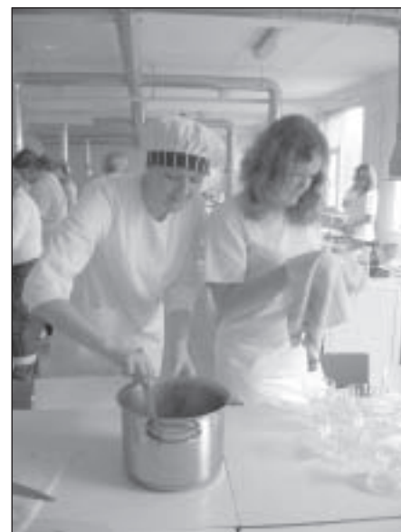
Ēdienu gatavošanas nodarbības