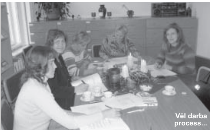
Vēl darba process...