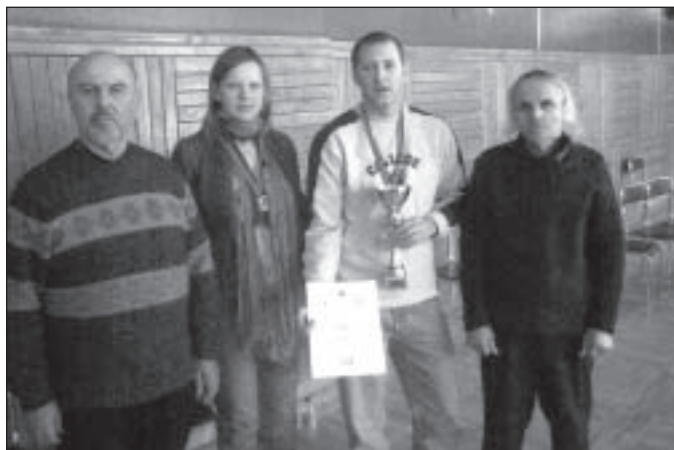
3. vietas ieguvēji ŠAHĀ – Mālpils komanda