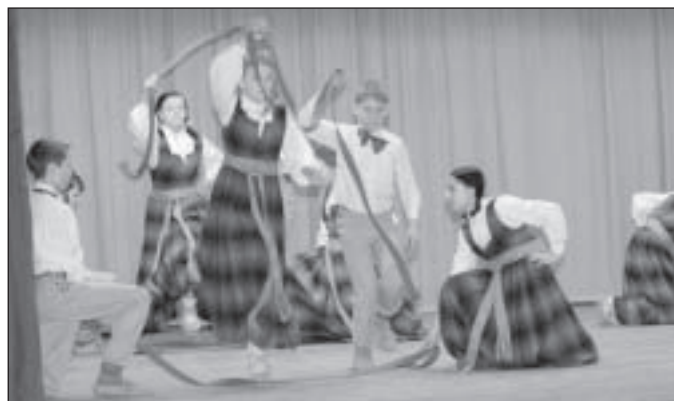
Dejotāji Siguldas pasākumā

Un nobeigumā gribu jums visiem novēlēt nu gluži kā A. Lindgrēnes Ronjai – UZ GALVAS IEVELTIET PAVASARĪ UN BAUDĪT ŠO JAUKO GADALAIKU AR SIRDĪ UN PRĀTU!