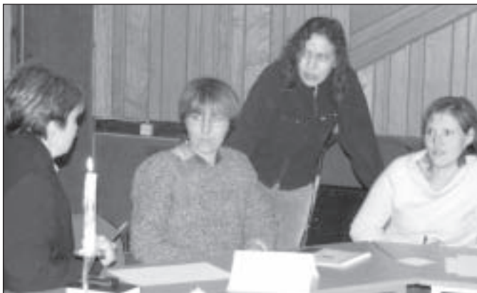
Tikšanās laikā notika dialogs starp pašvaldības iestāžu vadītājiem un ģimeņu pārstāvjiem

Veiksmi daudz bērnu ģimeņu atbalsta grupai un gatavību sadarboties izteica arī citu pašvaldības iestāžu vadītāji.