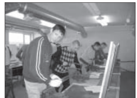
Atslēdznieku darbu konkursa norise