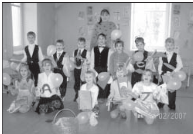
Ābece svētku gavilnieki

Jau otrreiz, sadarbojoties ar Siguldas autoskolu, skolā bija iespē-