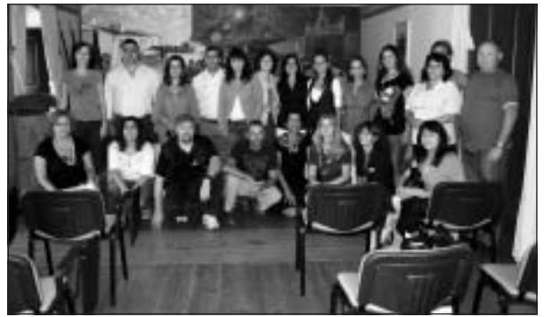
Projekta dalībnieki Vidigueiras pašvaldībā

saistās ar vietējās skolas un apvidus vēsturi, jo pats muzejs atrodas vecās skolas ēkā, kura arī savulaik te radās, pateicoties slavenajam Indijas atklājējam.