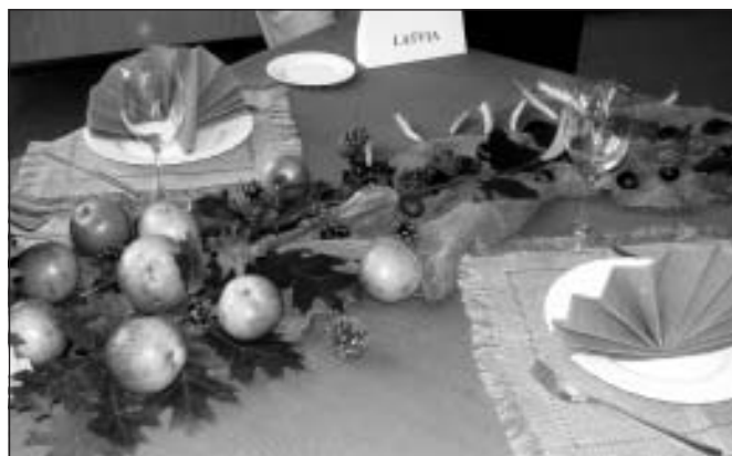
Mūsu galda klājums

Pirmajā projekta dienā prezentējām latviešu nacionālos ēdienus, ēšanas tradīcijas. Klātesošos cienājām ar pelēkajiem zirņiem, rupjmaizi, Mālpils sieru. Interesanta bija Maizes diena. Apmeklējām nelielu maizes ceptuvi, kurā iepazīnāmies ar maizes izgatavošanas tehnoloģiju. Vēlāk klājām galdu, piedalījāmies dažādu poļu nacionālo ēdienu gatavošanā. Protams, pēc tam notika degustācija, par ko vēlāk brīnījās mūsu vēderi.