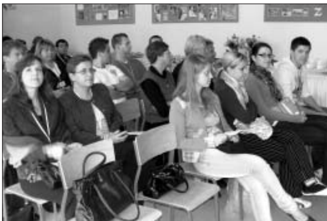
Maizes dienas pasākumā

Bija daudz spilgtu iespaidu ekskursijās: pastaiga pa Varšavu, Krakovas slavenā Vāveles pils, katedrāle, tikšanās ar Ēnstoховas mēru, slavenās Veličku sāls atradnes. Projekta laikā satikām dažādus cilvēkus, iepazīnām viņus, baudījām poļu viesmīlību. Ieguvām daudz draugu citās valstīs. Bijām priecīgi, ka tieši mums bija iespēja prezentēt Latviju, mūsu Mālpils Profesionālo vidusskolu. Paldies angļu valodas skolotājai E. Svikšai, kura mācīja mums angļu valodu, lai mēs varētu sarunāties ar citu valstu projekta dalībniekiem.