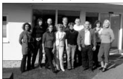
Kopā ar projekta partneriem no Vācijas, Itālijas Polijas un Portugāles

Projektā ietvaros jau ir uzsākti angļu valodas kursi trijās grupās klausītājiem ar dažāda līmeņa priekšzināšanām, kā arī datoriemaņu kursi trijās grupās. Atšķirībā