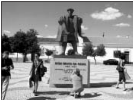
Vasko da Gamas piemineklis pilsētiņas centrā