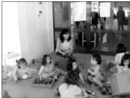
Portugāļu mazie skolēni