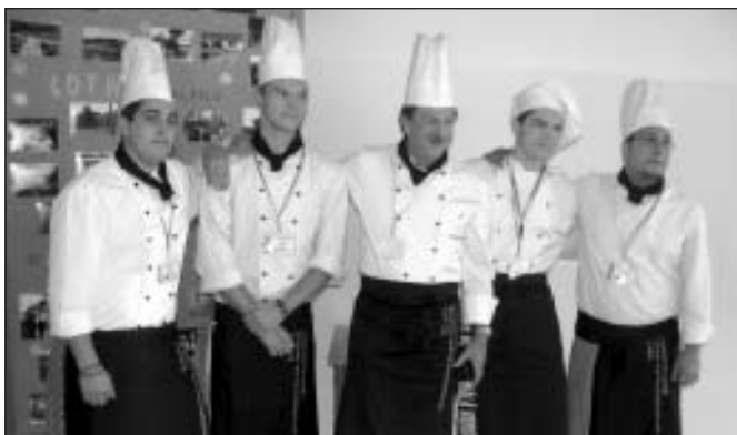
Gatavi darbam virtuvē