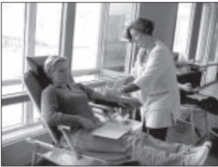
9. maijā Mālpils kultūras nama telpās tika organizēta Donoru diena. Asinis nodot