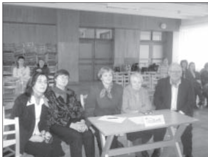
Konkurss Mālpils nedēļā